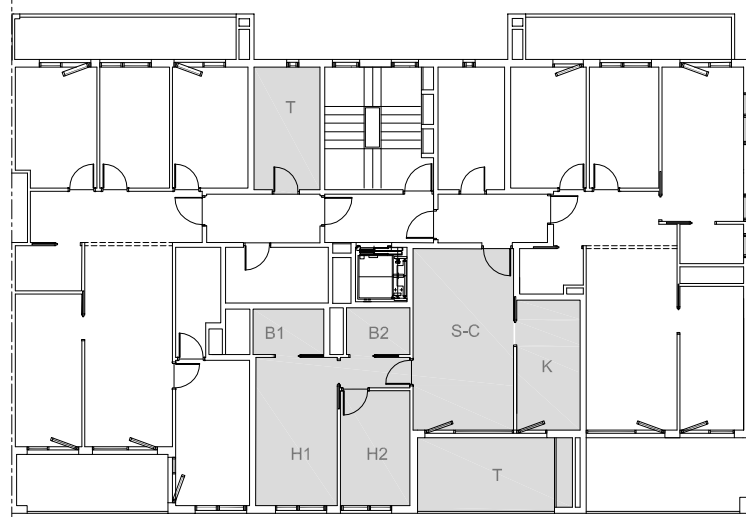
PLANTA CONJUNTO (A3) e: 1/250